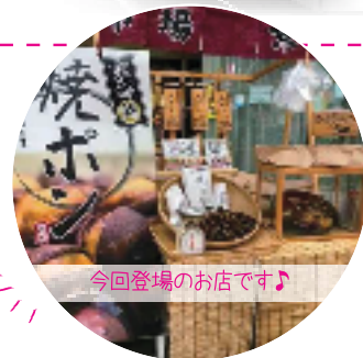
今回登場のお店です♪