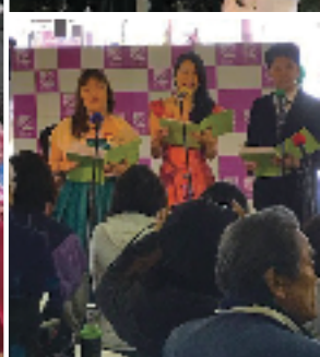
今年3/24(日)に開催された歌う！高蔵寺マーケットの様子