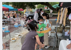
ジャグリング体験