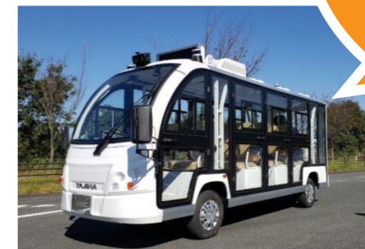
ゆっくりミニバス(定員6名)