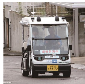
ゆっくりカート(定員2名)