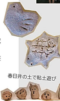
春日井の土で粘土遊び