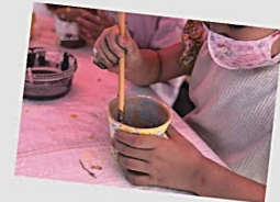
前回のツクル、やきもの絵付け