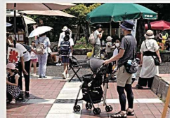
バルーンアート体験