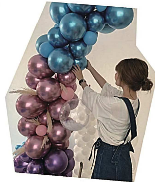
アート & アソブ

バルーンアート体験 体験料 500円 11時 12時 13時 14時開催 各回 4組まで