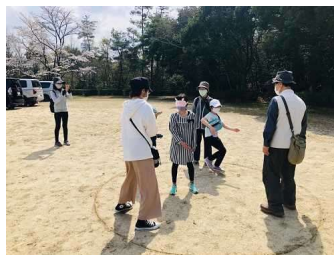
ネイチャーゲームで 楽しく自然を学ぶ