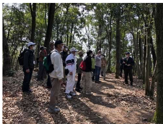
ガイドが高森山の 自然を説明