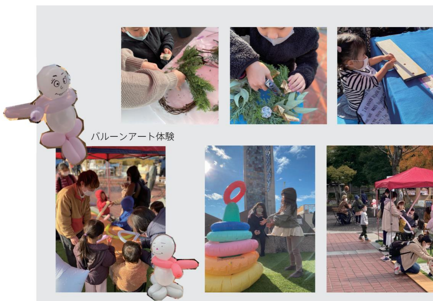
バルーンアート体験