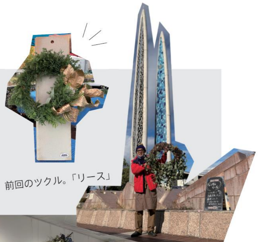
前回のツクル。「リース」