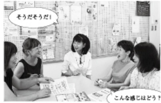
うふっと心がほっこりするような和菓子ね 皆さんとひとつの目的に向かって話し合うのって楽しい!

●グルッポふじとうでは、運営に協力していただける方(地域住民サポーター)を募集しています。